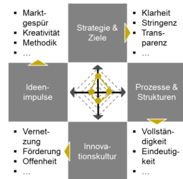
Abb. 1: Der „Innovationskompass“ als fundiertes Analyse-/Zielinstrument

Unternehmenskultur das Unternehmen darin unterstützen, die anstehenden Herausforderungen zu meistern. Darüber hinaus wird im Rahmen der Analyse auch der aktuelle Grad der im Unternehmen genutzten neuen Ideen identifiziert. Ein Abgleich mit Leading Innovation Practices rundet die Analyse ab.